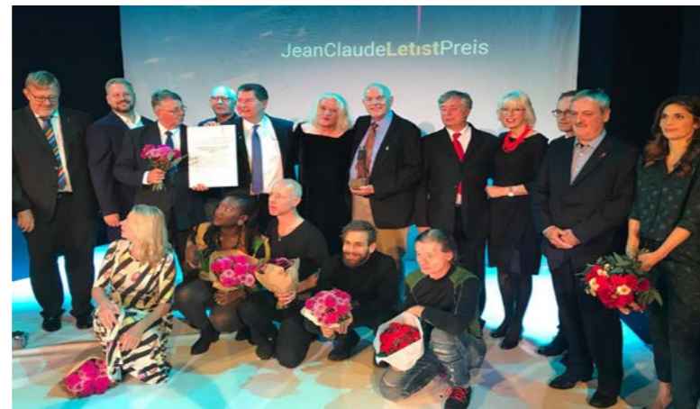
Verleihung des Jean-Claude-Letist-Preises an BISS, 2017, Köln.

Damit Erkenntnisse und Ideen nicht nur in dem engen Kreis der Teilnehmenden bleiben, sondern weitere Kreise ziehen können, braucht es BISS als Plattform. Wir bringen die Ergebnisse unserer Dialoge in einen größeren Diskurs ein.