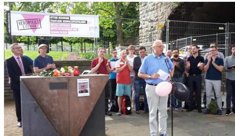
Aktion am Mahnmal für die ermordeten Lesben und Schwulen im Nationalsozialismus, 2016, Köln.