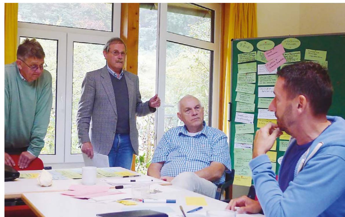
Seminar zur Gesundheit älterer schwuler Männer in der Akademie Waldschlösschen, 2015, bei Göttingen.