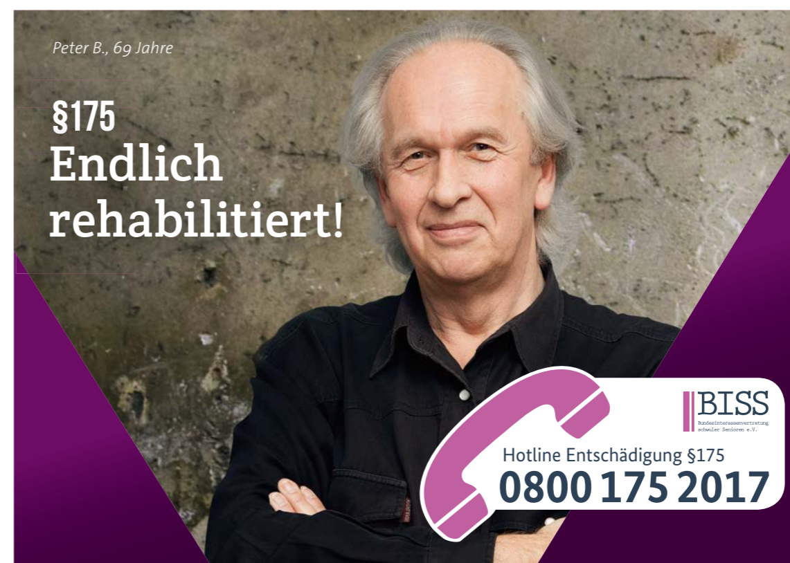
Nach der erfolgreichen Kampagne zur Rehabilitation informiert BISS seit 2017 alle Opfer mit einer Entschädigungshotline.