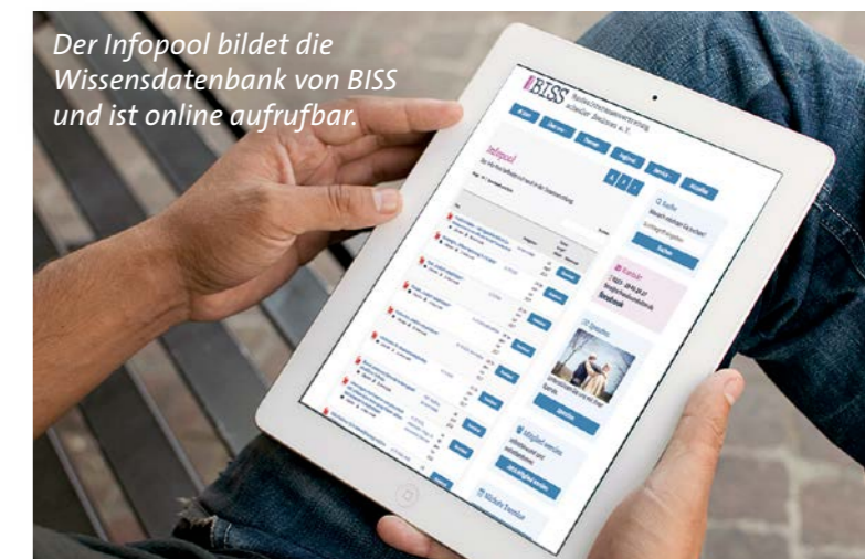
Der Infopool bildet die Wissensdatenbank von BISS und ist online aufrufbar.