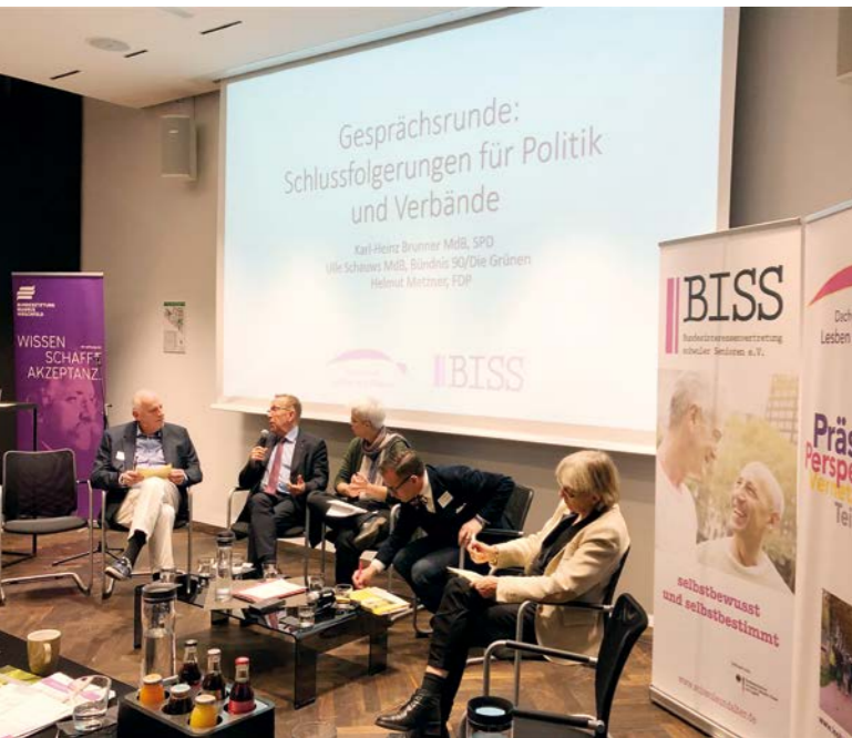
Dialog mit der Bundespolitik auf dem Fachtag „Altersarmut – auch ein Thema für Lesben und Schwule?“, 2018, Berlin.

Damit Erkenntnisse und Ideen nicht nur in dem engen Kreis der Teilnehmenden bleiben, sondern weitere Kreise ziehen können, braucht es BISS als Plattform. Wir bringen die Ergebnisse unserer Dialoge in einen größeren Diskurs ein.