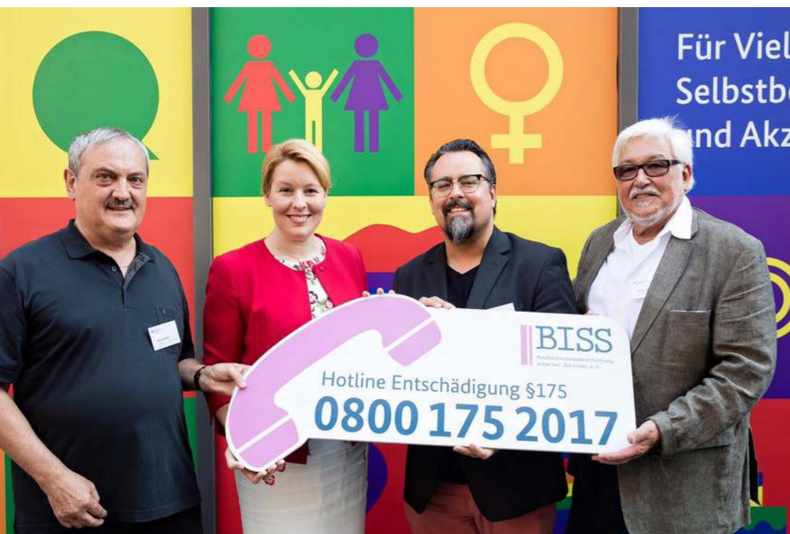
Bundesseniorenministerin Dr. Franziska Giffey unterstützt die Entschädigungshotline auf ihrem Community-Empfang, 2018, Berlin.

Die Gruppengröße bei Seminaren und Workshops ist begrenzt - ein Vorteil für all unsere Teilnehmenden, die Themen in einem kleineren und tieferen Rahmen bearbeiten wollen. Hierzu gehört insbesondere die Zusammenarbeit mit der Akademie Waldschlösschen, zum Beispiel das jährlich stattfindende Seminar „Wir haben noch viel Saft“, aus dem heraus unser Verband entstanden ist. Außerdem kooperieren wir mit Aidshilfen und Mitgliedsvereinen, zum Beispiel in Berlin, Dresden, Hamburg, Kiel, Leipzig, München und Nürnberg. Dabei rücken wir Themen wie HIV und schwule Gesundheit im Alter, Sensibilisierung der Altenhilfe vor Ort, Informationen zur Rehabilitation und weitere Fragen zum Altern in den Mittelpunkt.