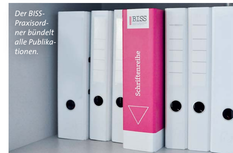
Der BISS-Praxisordner bündelt alle Publikationen.