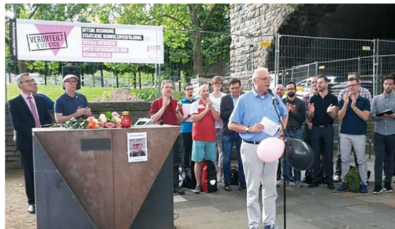
Aktion am Mahnmal für die ermordeten Lesben und Schwulen im Nationalsozialismus, 2016, Köln.