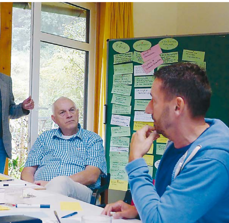
Seminar zur Gesundheit älterer schwuler Männer in der Akademie Waldschlösschen, 2015, bei Göttingen.

Die Gruppengröße bei Seminaren und Workshops ist begrenzt - ein Vorteil für all unsere Teilnehmenden, die Themen in einem kleineren und tieferen Rahmen bearbeiten wollen. Hierzu gehört insbesondere die Zusammenarbeit mit der Akademie Waldschlösschen, zum Beispiel das jährlich stattfindende Seminar „Wir haben noch viel Saft“, aus dem heraus unser Verband entstanden ist. Außerdem kooperieren wir mit Aidshilfen und Mitgliedsvereinen, zum Beispiel in Berlin, Dresden, Hamburg, Kiel, Leipzig, München und Nürnberg. Dabei rücken wir Themen wie HIV und schwule Gesundheit im Alter, Sensibilisierung der Altenhilfe vor Ort, Informationen zur Rehabilitation und weitere Fragen zum Altern in den Mittelpunkt.