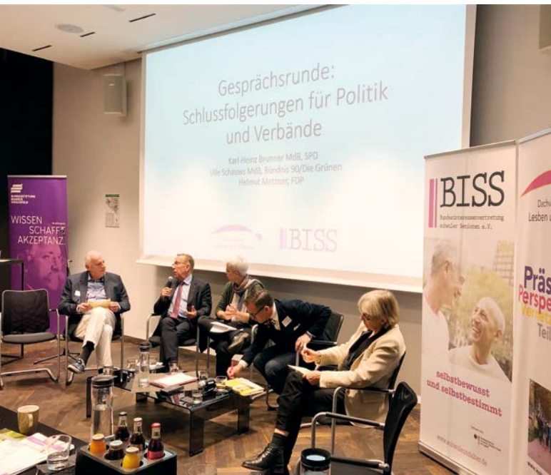
Dialog mit der Bundespolitik auf dem Fachtag „Altersarmut – auch ein Thema für Lesben und Schwule?“, 2018, Berlin.

Damit Erkenntnisse und Ideen nicht nur in dem engen Kreis der Teilnehmenden bleiben, sondern weitere Kreise ziehen können, braucht es BISS als Plattform. Wir bringen die Ergebnisse unserer Dialoge in einen größeren Diskurs ein.