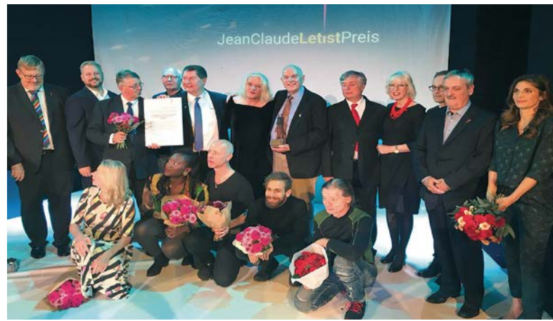
Verleihung des Jean-Claude-Letist-Preises an BISS, 2017, Köln.

Damit Erkenntnisse und Ideen nicht nur in dem engen Kreis der Teilnehmenden bleiben, sondern weitere Kreise ziehen können, braucht es BISS als Plattform. Wir bringen die Ergebnisse unserer Dialoge in einen größeren Diskurs ein.