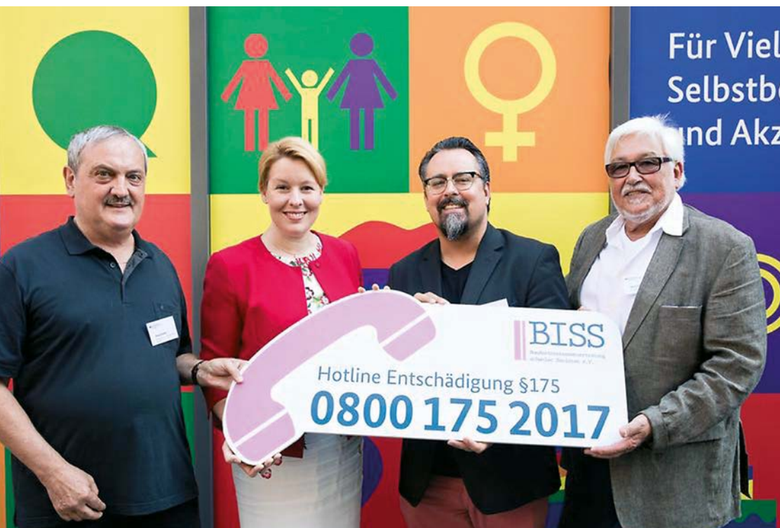
Bundesseniorenministerin Dr. Franziska Giffey unterstützt die Entschädigungshotline auf ihrem Community-Empfang, 2018, Berlin.