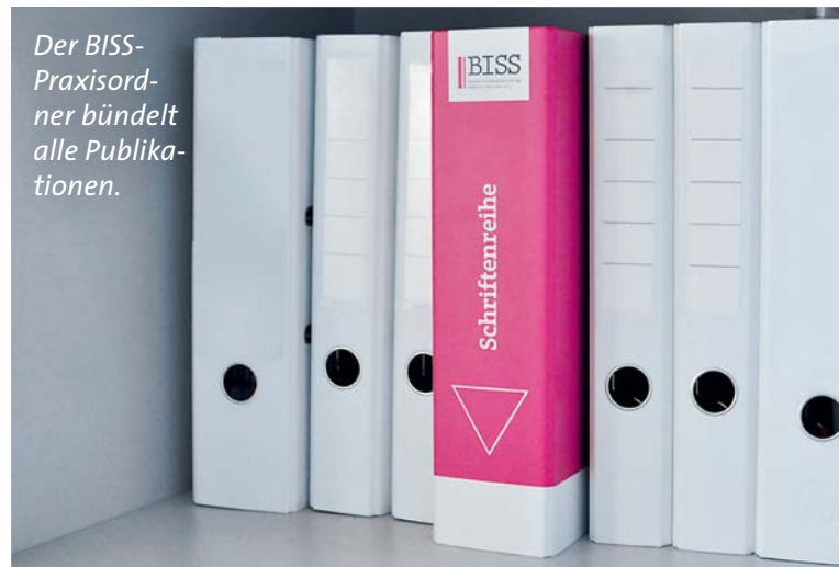
Der BISS-Praxisordner bündelt alle Publikationen.